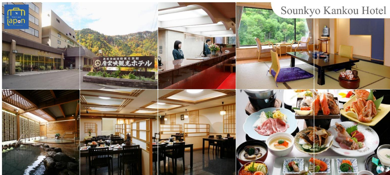
Sounkyo Kankou Hotel

หลังอาหารให้ท่านได้ผ่อนคลายกับการแช่น้ำแร่ธรรมชาติ เชื่อว่าถ้าได้แช่น้ำแร่แล้ว จะทำให้ผิวพรรณสวยงามและช่วยให้ระบบหมุนเวียนโลหิตดีขึ้น