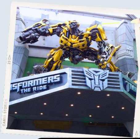
ZONE 1 : HOLLYWOOD