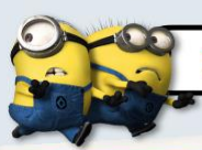
ZONE 5 : THE LOST WORLD