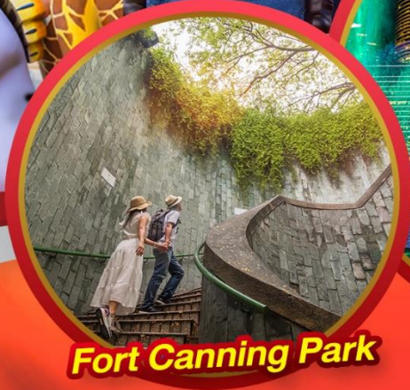
Fort Canning Park