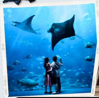
ZONE 7 : FAR FAR AWAY